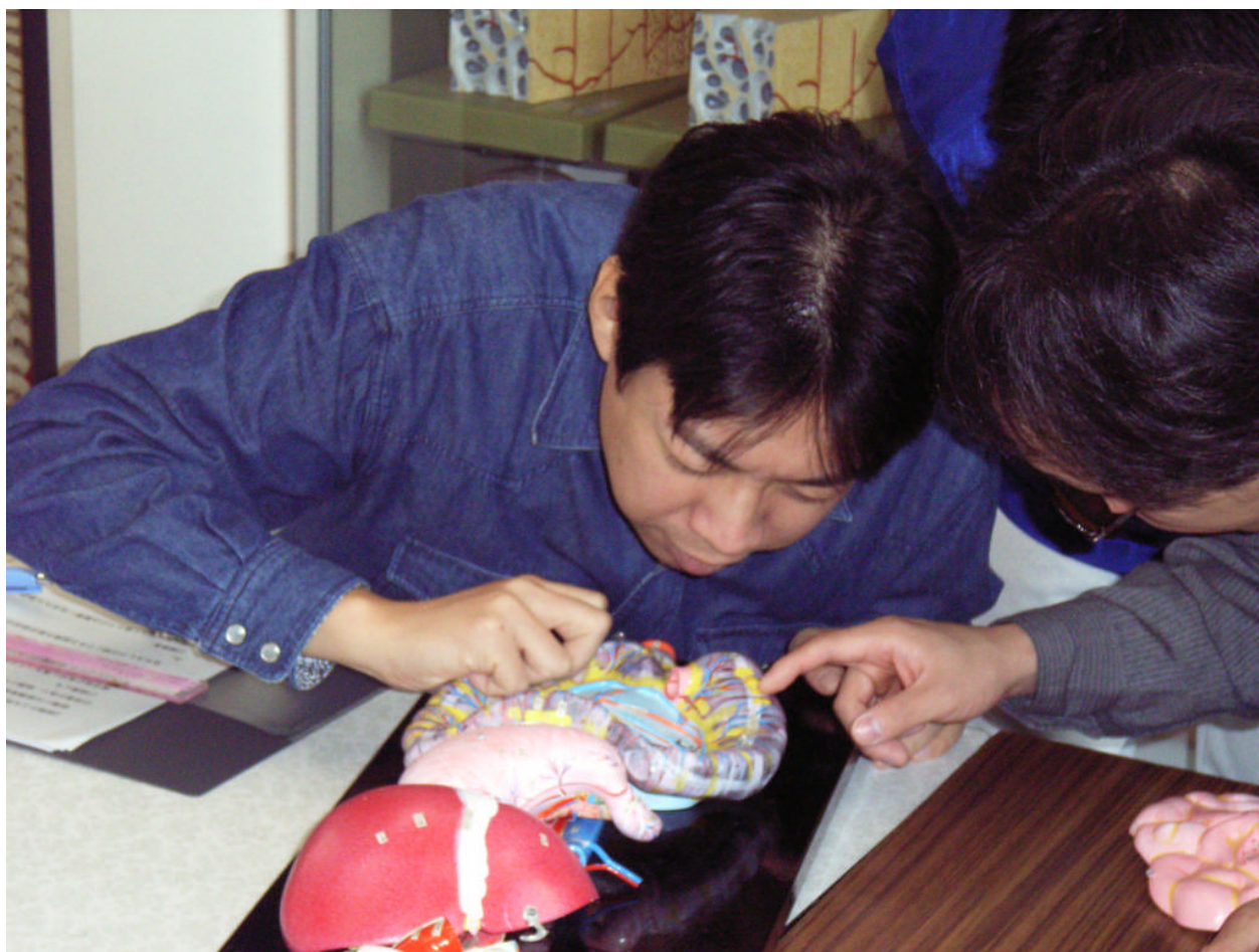
弱視の生徒が解剖学の模型を使って実習を行う(内臓系の授業風景)

障害者雇用促進を積極的に推進している企業は、この制度を財源として、各種助成金以外にも障害者雇用調整金や報奨金、在宅就労障害者特例調整金の支給を受けることができます。