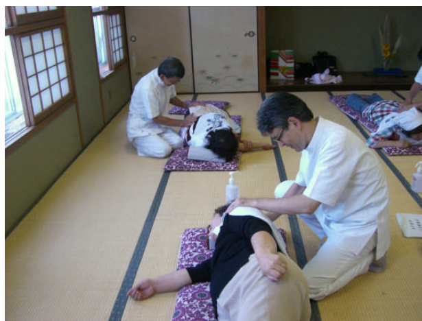
敬老の日には地域で奉仕治療が行われる