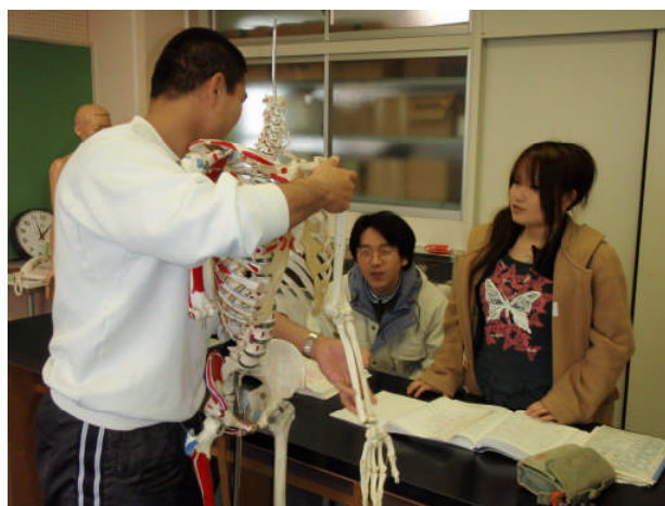
解剖学の授業風景（生徒は弱視）