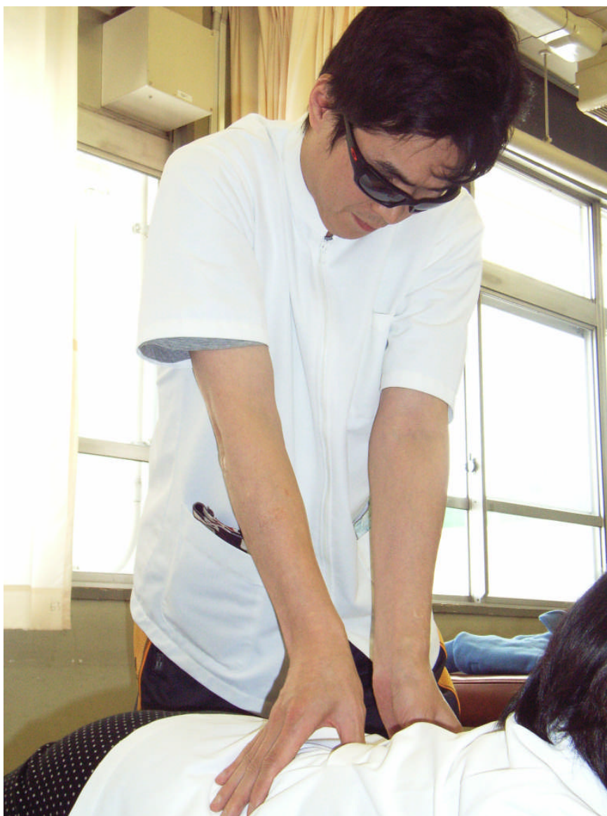
盲学校のあん摩マッサージ実習風景

視覚障害者と共に働く時は、固定概念を捨てて、ありのままを理解していただきたいと思います。一人一人の視覚障害者と接する中で、何ができて何ができないか、どのようなサポートが必要か、理解していただけるものと思います。