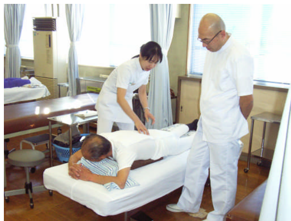
3年生の臨床実習本番をひかえ、模擬臨床実習が行われる

ジョブコーチによる支援は、障害者と事業主に支援を行ないながら上司や同僚に適切な支援方法を伝え、支援終了後は事業主による支援が継続されるよう、支援主体を事業所の担当者に徐々に移行していくものです。