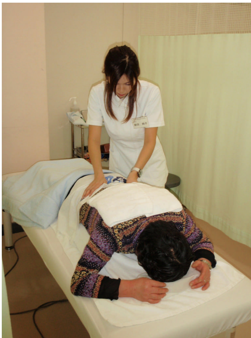
3年生の臨床室では地域の患者さんに治療を行う

視覚障害者の雇用促進、とりわけ、その大きなウエイトを占める、マッサージ・はり・きゅう業への就職を進めるため、各種の支援策が講じられています。